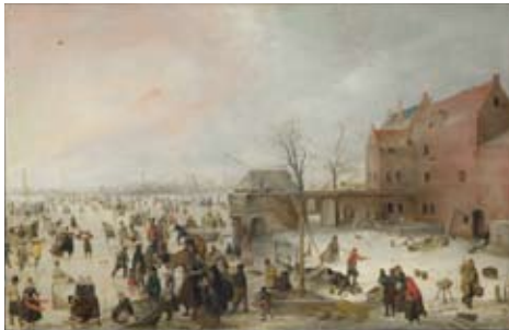
Hendrich Avercamp (1585–1634) A Scene on the Ice near a Town Een tafereel op het ijs bij een Stad about 1615

Avercamp was famous for his anecdotal details. Do you see the woman who has slipped on the ice?