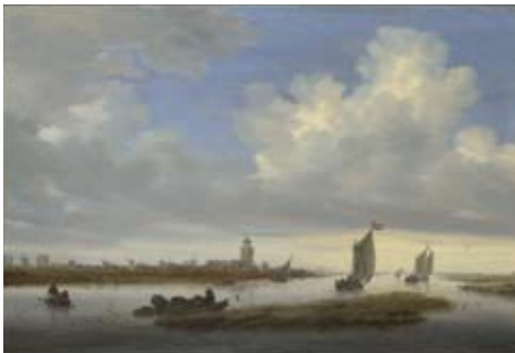
Salomon van Ruysdael (1600/3?–1670) A View of Deventer seen from the North-West Gezicht op Deventer vanuit het noordwesten 1657

Presented by William Edward Brandt, Henry Augustus Brandt, Walter Augustus Brandt and Alice Mary Blecker in memory of Rudolf Ernst Brandt, 1962