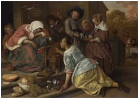
Jan Steen (1626–1679) The Effects of Intemperance De Gevolgen van Onmatigheid about 1663–5

Even today, the Dutch call a lively, untidy home a 'Jan Steen household' – a phrase inspired by the riotous paintings by this 17th-century artist. Here, as a housewife sleeps off the effects of tobacco and wine, chaos reigns: one child steals from her purse while another feeds the family dinner to the cat. Several details illustrate Dutch proverbs, such as the child who tosses roses before a pig (and thus wastes something valuable). Punishment awaits this woman, who has failed to set a good example for her children. Above her head is a basket filled with various objects associated with poverty and disease.