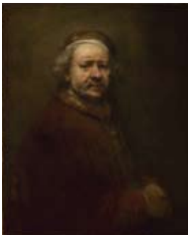
Rembrandt (1606–1669) Self Portrait at the Age of 63 Zelfportret op 63-jarige leeftijd 1669

Can you see the scratch marks Rembrandt made in the paint with the wrong end of his brush?