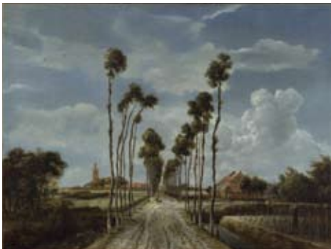
Meindert Hobbema (1638–1709) The Avenue at Middelharnis Het laantje van Middelharnis 1689

What do you think the gardener in the bottom right-hand corner is doing?