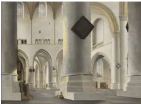
Pieter Saenredam (1597–1665) Interior of the Grote Kerk at Haarlem Interieur van de Grote Kerk in Haarlem 1636–7