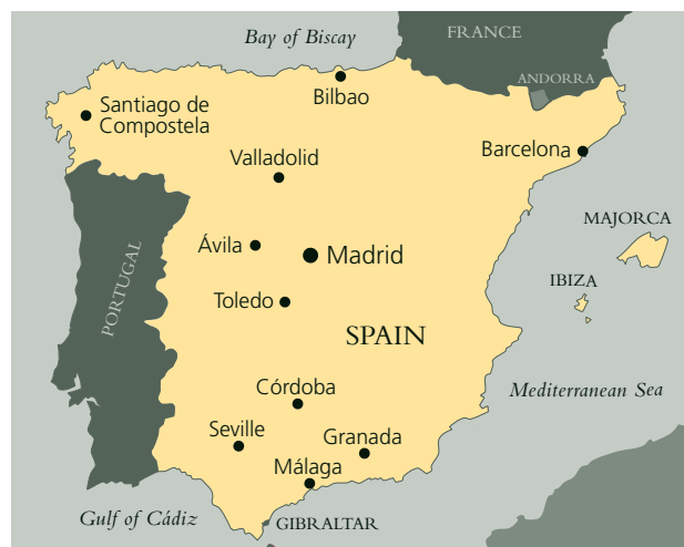
Carte de l'Espagne d'aujourd'hui

Elle a bénéficiée du soutien du Government Indemnity Scheme, qui est pourvu par le DCMS et administré par le MLA.