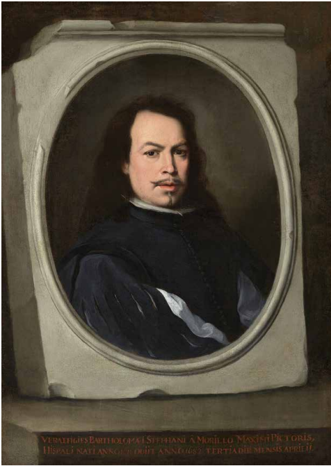
Bartolomé Esteban Murillo, Zelfportret , ca. 1650-55.