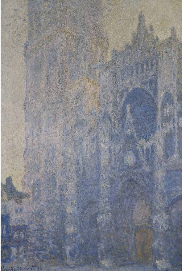
Afbeelding: Claude Monet De façade van de kathedraal van Rouen en Tour d'Albane (ochtendeffect) 1894