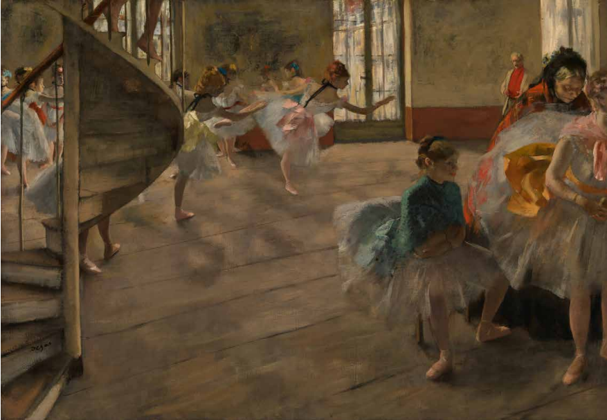
Afbeelding: Hilaire-Germain-Edgar Degas, De Repetitie , ca. 1874