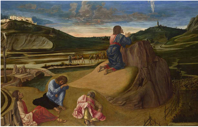
Afbeelding: Giovanni Bellini, De Lijdensweg in de Tuin , ca. 1465