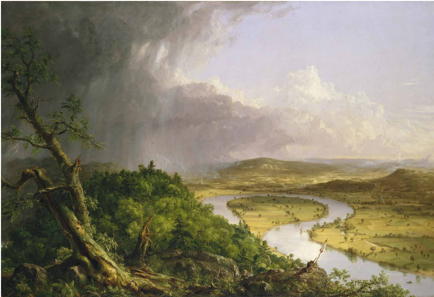
Afbeelding: Thomas Cole, Uitzicht vanaf Mount Holyoke, Northampton, Massachusetts, na het onweer—The Oxbow , 1836