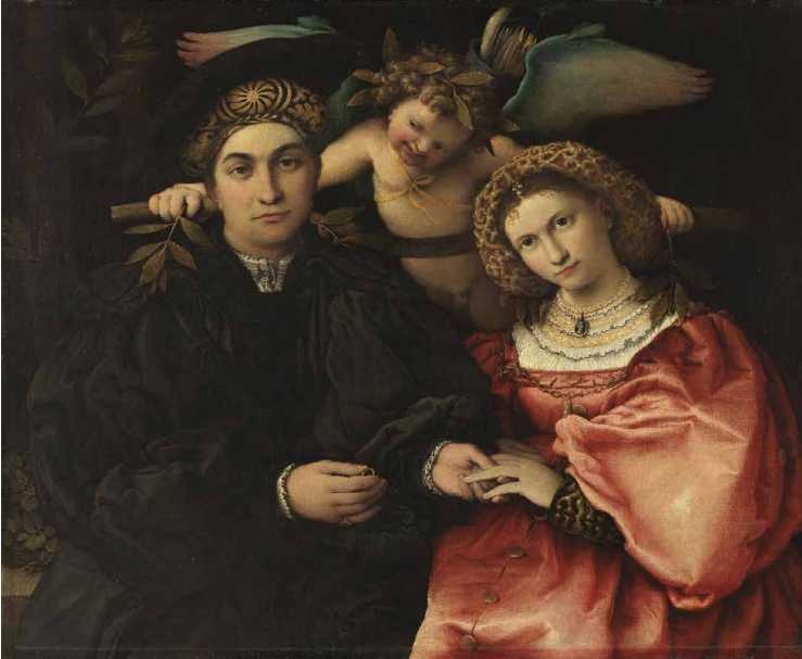
Afbeelding: Lorenzo Lotto, Marsilio Cassotti en zijn vrouw Faustina , 1523 © Museo Nacional del Prado, Madrid