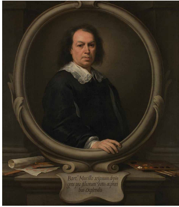
Bartolomé Esteban Murillo, Zelfportret , waarschijnlijk 1668-70