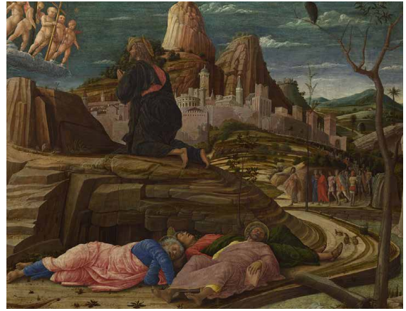
Afbeelding: Andrea Mantegna, De Lijdensweg in de Tuin , ca. 1458-60