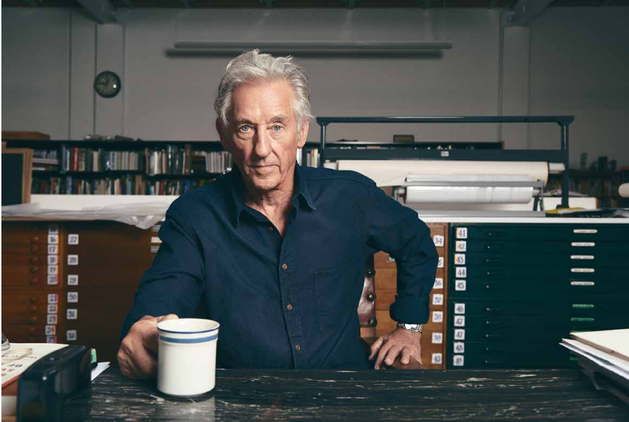
Ed Ruscha Met dank aan Ed Ruscha en Gagosian