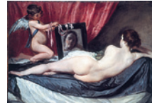
Velázquez La Vénus Rokeby Salle 30