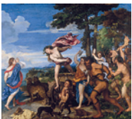
Titien Bacchus et Ariane Salle 9