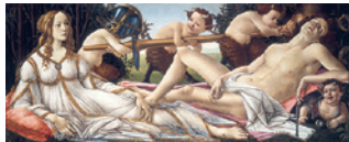
Botticelli Mars et Vénus Salle 58