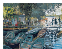
Monet Baigneurs à La Grenouillère Salle 43