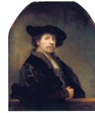
Rembrandt Autoportrait à l'âge de trente-quatre ans Salle 24