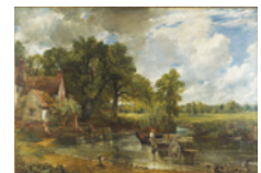
Constable La Charrette de foin Salle 34