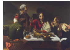
Caravage La Cène à Emmaüs Salle 32

Bien que certains artistes se soient tournés vers l'art du passé pour trouver l'inspiration, ils ont toujours apporté leur propre style, fût-il flamboyant ou austère. Les thèmes religieux furent traités de manière nouvelle, afin de susciter les émotions du spectateur. Aux Pays-Bas, les peintres spécialistes de natures mortes, paysages ou scènes du quotidien (qu'il s'agisse d'élégants rassemblements mondains ou de scènes vivantes dans les tavernes), jouissaient d'une grande popularité.