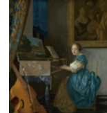
Vermeer A Young Woman seated at a Virginal Salle 25