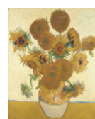
Van Gogh Les tournesols Salle 45