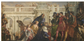
Veronese The Family of Darius before Alexander Salle 9