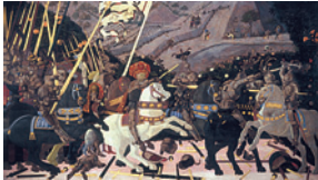
Uccello La Bataille de San Romano Salle 54

La plupart des tableaux du Moyen-âge ayant survécu sont à caractère religieux. Ils ont été conçus pour les autels des églises ou la prière en privé. Bon nombre d'entre eux présentent de délicats arrière-plans recouverts de feuilles d'or. Au 15 e siècle, les artistes ont de plus en plus allié mysticisme et réalisme, non seulement dans les œuvres religieuses, mais aussi dans les portraits et les mythologies. Bien souvent, les silhouettes apparaissaient dans des paysages et cadres architecturaux très convaincants. Les avancées techniques, telles que la peinture à l'huile, ont permis une plus grande subtilité dans la représentation des expressions de visage et la texture des surfaces.