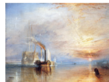
Turner Le dernier voyage du téméraire Salle 34

Bien que la production de grandes fresques pour les églises et les palais était encore d'actualité, il était plus courant pour les artistes de l'époque de peindre des œuvres plus petites, qui étaient exposées et vendues par le biais de marchands et d'expositions publiques. Et c'est au 19 e siècle que les mouvements artistiques (associations libres d'artistes travaillant dans un style similaire) ont émergé, tout comme l'idée de l'artiste indépendant se rebellant contre l'establishment artistique officiel.