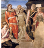
Michel-Ange La Mise au tombeau Salle 8