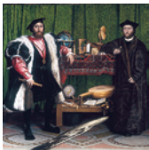
Holbein Les Ambassadeurs Salle 4

L'immense notoriété acquise par les grands artistes de cette période reste inchangée. En Italie, les peintres de la Renaissance cherchaient à rivaliser, voire à dépasser, les artistes de la Grèce et de la Rome antiques. Les portraitistes étaient très recherchés, et les tableaux représentant l'histoire ancienne et la mythologie devinrent presque aussi importants que les tableaux religieux. Les peintures, appréciées non seulement sur le plan artistique mais aussi thématique, étaient souvent exposées dans des galeries spécialement conçues.